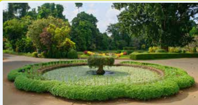
KANDY - Peradeniya Garden

Questi giardini sono considerati tra i più ricchi al mondo per la varietà di specie ornamentali e spezie che ospitano.