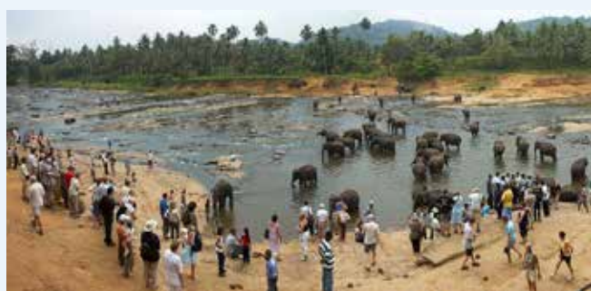
PINNAWELA - Orfanotrofio degli elefanti

Arrivo all'aeroporto internazionale di Colombo, formalità di ingresso e ritiro bagagli. Incontro con la guida e trasferimento in direzione Kandy. Lungo il percorso ci fermiamo a Pinnawela per visitare la Millennium Elephant Foundation, famosa per l'orfanotrofio degli elefanti.