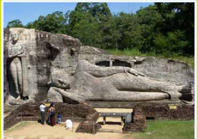
POLONNARUWA - Buddha reclinato

Pranzo durante l'escursione. Nel pomeriggio escursione a Polonnaruwa, l'antica capitale del regno dello Sri Lanka. Complesso architettonico composto da templi, palazzi e una bellissima piscina a forma di fiore di loto. Cena e pernottamento in hotel.