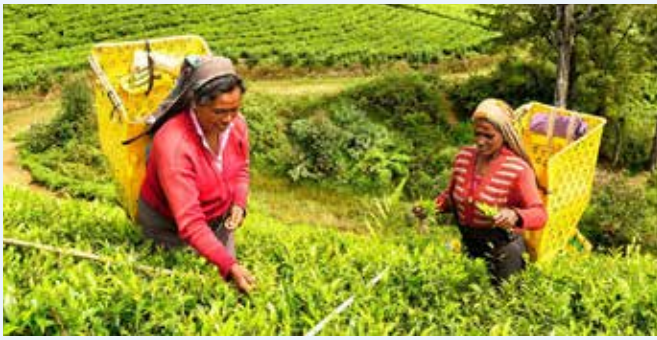
NUWARA ELIYA - Piantagione di tè

Colazione in hotel. Partenza per Nuwara Eliya con sosta lungo il percorso in una piantagione di tè e fabbrica.