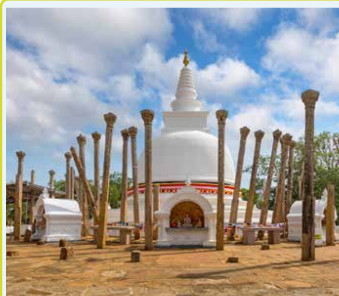
ANURADHAPURA - Lankaramaya

Il pomeriggio sarà dedicato a un safari del villaggio, un'esperienza interessante che vi permetterà di entrare in contatto con la vita rurale della popolazione locale. L'escursione verrà effettuata con i mezzi tipici locali: si inizierà con un tuk-tuk, si proseguirà con carretti trainati da buoi e infine con una gita in barca. Ritorno in hotel per la cena e il pernottamento.