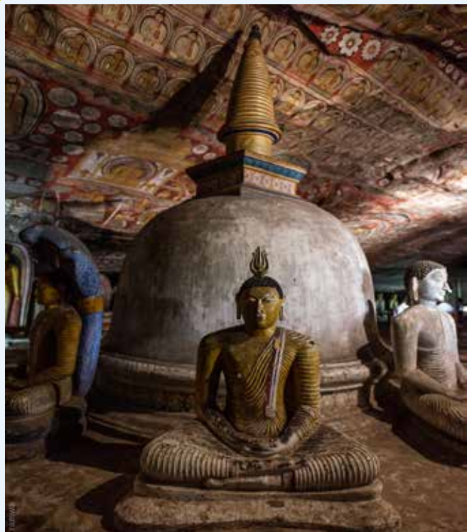
DAMBULLA - Templi delle Grotte

Colazione in hotel. Partenza da Kandy con sosta lungo il percorso per visitare i Templi delle Grotte di Dambulla, luogo religioso e storico dove sono conservate in 5 diverse grotte 150 statue di Buddha.